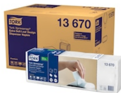
Tork XPN DispNap leaf 2P 4F 100/5 /8 13670