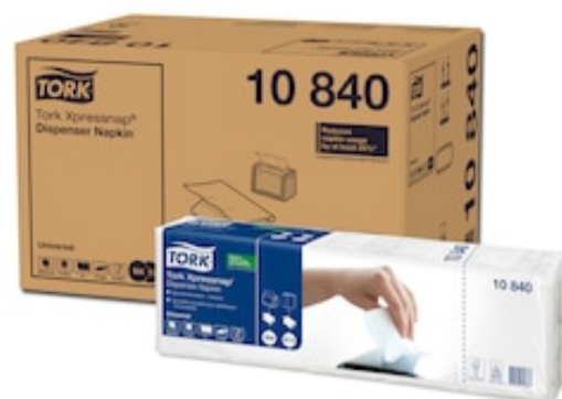
Tork Univ Napk Interf 1p 21,6x33 225 /5/8 10840