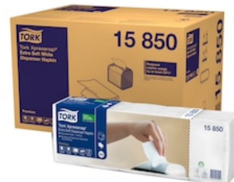
Tork PremNapk Inter 2p21,6x16,5 200 /5/8 15850