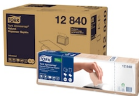
Tork XPN DispNap nat 1P 4F 225/5 /8 12840