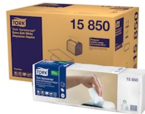
Tork PremNapk Inter 2p21,6x16,5 200 /5/8 15850