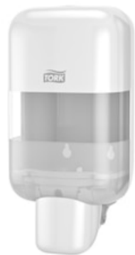
Tork Mini Soap&Sanitizer Disp.Wh 565200