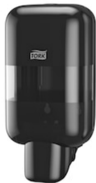
Tork Mini Soap&Sanitizer Disp.Bl 565208