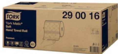
Tork Matic Soft HTR Prem 2p 100m 290016