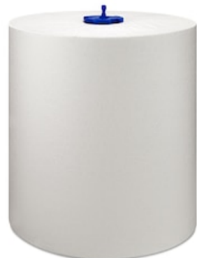
Tork Matic Extra Long HTR Uni 1p 280m 290059