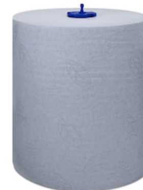
Tork Matic Blue HTR Adv 2p 150m 290068