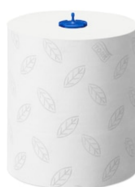
Tork Matic Soft HTR Adv 2p 150m 290067